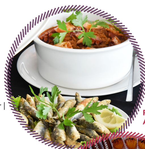
Petinga Frita Arroz de Polvo

Entrada Livre nos Museus: Centro de Memória, Alfândega Régia - Museu de Construção Naval e Nau Quinhentista, Museu das Rendas de Bilros