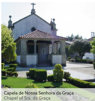
Capela de Nossa Senhora da Graça Chapel of Sra. da Graça