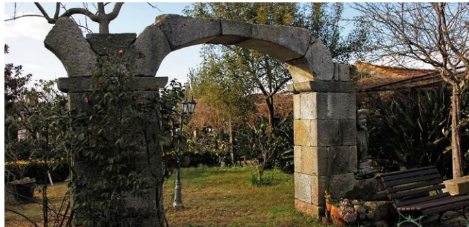
Quinta das Camélias | Camélias' s Farm