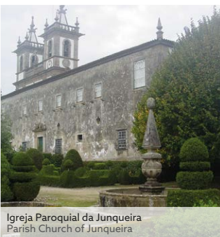
Igreja Paroquial da Junqueira Parish Church of Junqueira