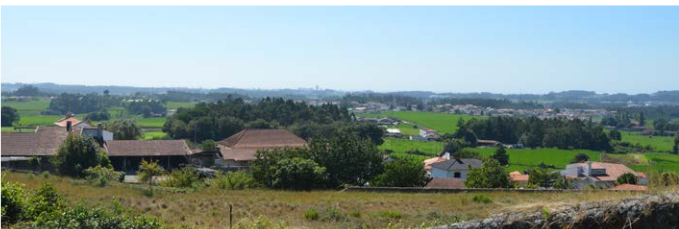
Vista Panorâmica | Panoramic View

From here, the three routes proceed together, through agricultural fields, mostly filled with corn and flanked by stone walls. The engraving "Truta de Chantada" appears on one of these walls. Shortly after, in the locality of Casavedra, this route separates from the others, continuing towards Garrida. Before this locality, it turns to Largo do Quelhas and Alminha Garrida, taking the M525, which quickly leaves towards Vilar de Matos, where a visit to the Quinta das Camélias is suggested. The return to the starting point is made heading towards the Chapel of Sra. da Graça.