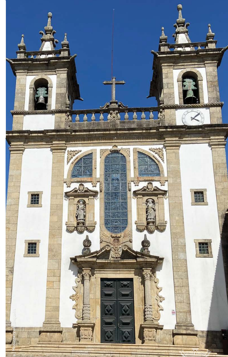
Mosteiro da Junqueira | Monastery of Junqueira